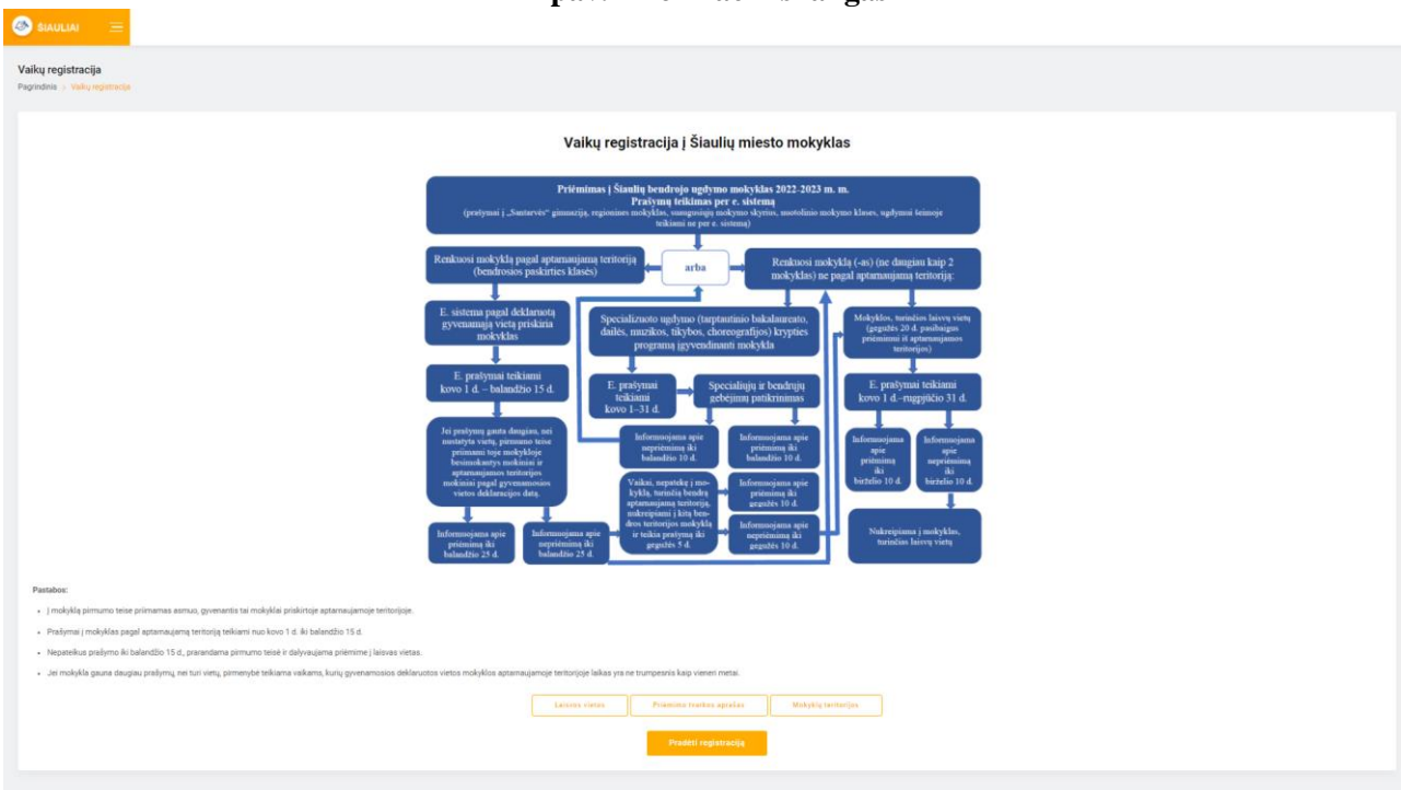
2 pav. Informacinis langas

3. Paspaudus laukelį „Registracija“, atsiveria informacinis langas (žr. 2 pav.), kuriame pateikiama bendra informacija apie mokinių priėmimą į mokyklas: priėmimo procedūros ir terminai, nuorodos į Priėmimo tvarkos aprašą, Mokyklų teritorijų aprašą ir laisvų vietų sąrašą. Susipažinus su informacija galima spausti mygtuką „Pradėti registraciją“.